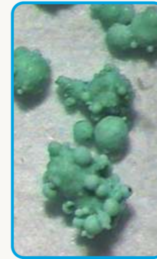
Granuli di CUPROTEK DISPERSS®