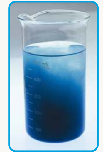
Dopo due minuti