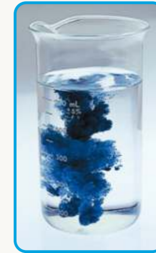
Dispersione in acqua